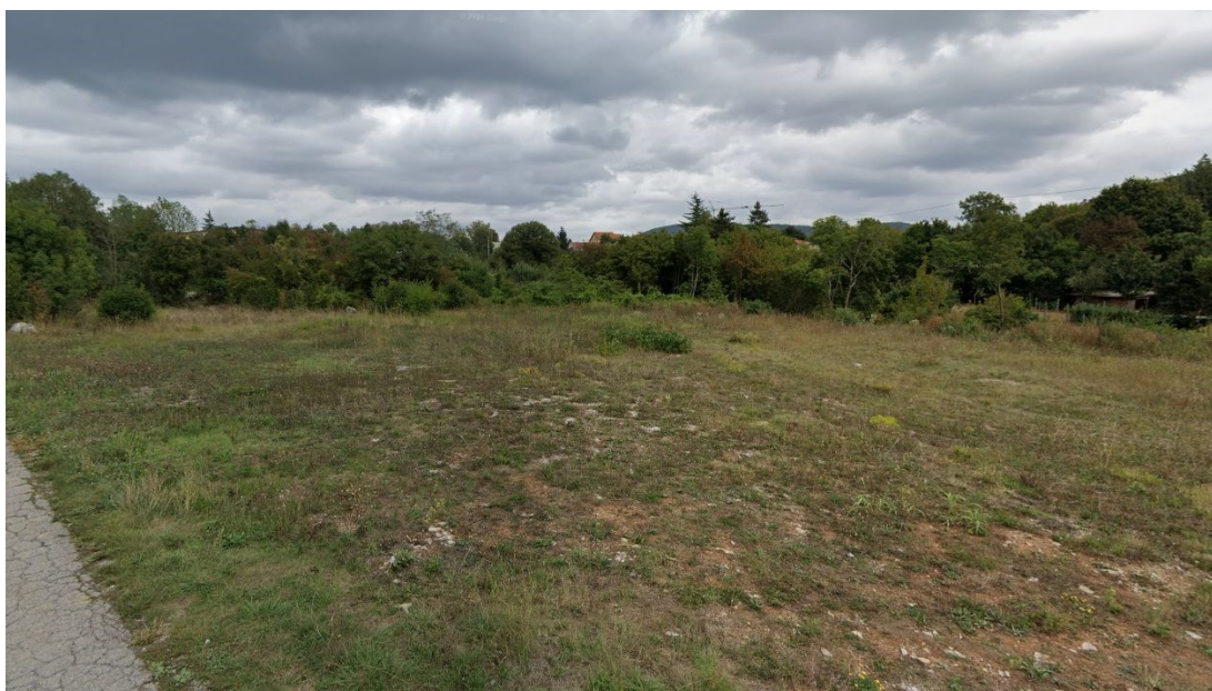
Slika 2: Obstoječe stanje obravnavanega območja

Vir: Google Street View, https://www.google.com/maps/ , september 2025